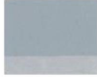
280 ■ ★★★★★ Cold Grey P.W. 6 / P.Bk. 10