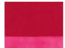
164 □ ★★★★★ Permanent Rose P.V. 19 L