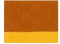
133 □ ★★★★★ Transparent Gold Ochre P.Y. 150 / P.Br.25