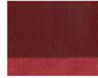
155 ■ ★★★★★ English Red Deep P.R. 101 D