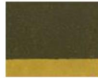
213 ■ ★★★★★ Green Earth Light P.Br.7 / P.Y.42 / P.Y.150 / P.G.7