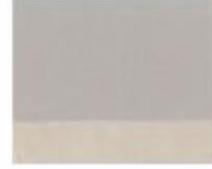
281 ■ ★★★★★ Neutral Grey P.W. 6 / P.Bk. 33