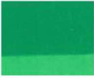
275 ■ ★★★★★ Grass Green light P.Y.184 L / P.G. 7