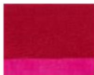
167 □ ★★★★★ Permanent Ruby P.R. 122