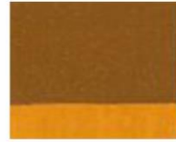
123 ■ ★★★★★ Golden Ochre P.Br. 7 / P.Y. 150 / P.Y. 42