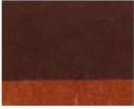
209 ■ ★★★★★ Burnt Sienna P.Br. 7 / P.R. 101