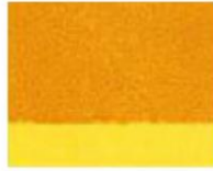
132 □ ★★★★★ Transparent Golden Yellow P.Y. 150