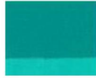
264 ■ ★★★★★ Emerald Green P.G. 7 / P.W.6