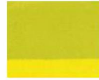
120 ■ ★★★★★ Yellow Green P.Y. 74 / P.G. 17