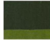
214 ■ ★★★★★ Green Earth Deep P.Br.7 / P.Y.42 / P.Y.150 / P.G.7