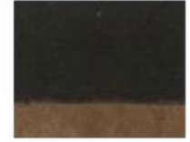
212 ■ ★★★★★ Van Dyke Brown P.Br. 7