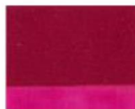
168 □ ★★★★★ Permanent Red Violet P.V. 19 D