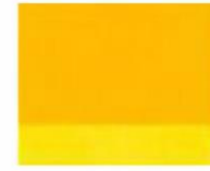
127 ■ ★★★★★ Cadmium Yellow Dark (imitation) P.Y. 139 / P.Y. 184