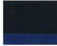
232 ■ ★★★★★ Indigo P.B. 60 / P.V. 19 / P.Bk. 33