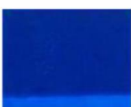
237 □ ★★★★★ Ultramarine Blue Deep P.B. 29 RL / P.B. 29 RD