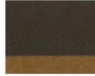
210 ■ ★★★★★ Natural Umber P.Br. 7