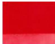
186 ■ ★★★★★ Cinnabar Red Deep P.R. 254