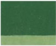
255 ■ ★★★★★ Chrome Oxide Green P.G. 17