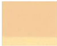
140 ■ ★★★★★ Flesh Colour P.Y. 42 / P.R.101 / P.W.6