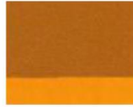
139 ■ ★★★★★ Raw Sienna P.Y. 42