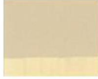
279 ■ ★★★★★ Warm Gray P.W. 6 / P.Br. 7