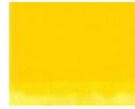
126 ■ ★★★★★ Cadmium Yellow (imitation) P.Y. 74 / P.Y. 139