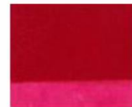
161 □ ★★★★★ Carmine Red P.R. 122 / P.R. 264 tr. / P.R. 254