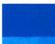
224 ■ ★★★★★ Cobalt Blue Deep P.B.28 / P.B.29 / P.B.15 / P.W.6