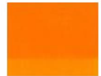
129 ■ ★★★★★ Orange P.O. 62