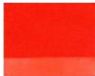
185 ■ ★★★★★ Vermilion Red Light P.R. 255