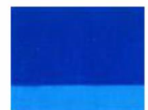
235 □ ★★★★★ Ultramarine Blue Light P.B. 29 G / P.B. 29 RL