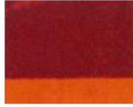
203 □ ★★★★★ Gold Transparent Red P.Br. 25 / P.R. 264 / P.Y. 150