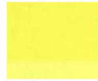
119 ■ ★★★★★ Oxide Yellow Lemon P.Y. 184 G