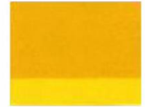
130 ■ ★★★★★ Yellow Ocher P.Y. 42 Y / P.Y. 74