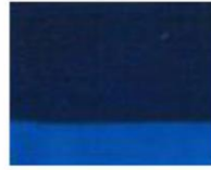
234 ■ ★★★★★ Prussian blue P.B. 15:6 / P.Bk. 33