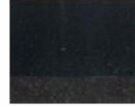
282 ■ ★★★★★ Black Oxide P.Bk. 11