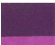
241 ■ ★★★★★ Cobalt Violet Deep P.R. 122 / P.V. 23 / P.W.6