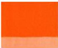
118 ■ ★★★★★ Intense Orange P.O.73