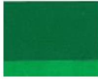
251 ■ ★★★★★ Grass Green Deep P.Y. 184 G / P.Y. 74 / P.G. 7