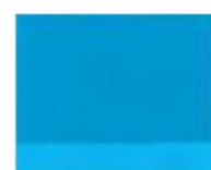
221 ■ ★★★★★ Cerulean Blue P.B. 15:3 / P.B. 16 / P.W.6