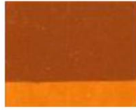
156 ■ ★★★★★ Red Ocher P.Y. 42 R