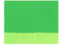
274 ■ ★★★★★ Cinnabar Green P.Y.184 L / P.G. 36