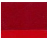
166 □ ★★★★★ Permanent Madder Deep P.R. 264 tr. / P.V. 15