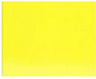
112 ■ ★★★★★ Oxide Yellow P.Y.184 M