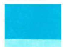
229 □ ★★★★★ Cobalt turquoise Light P.G. 50 B