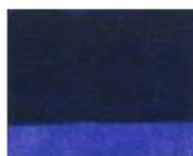
240 □ ★★★★★ Permanent Blue Violet P.V. 15 / P.V. 23