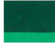
262 □ ★★★★★ Oxide Green Light (phthalo) P.G. 36