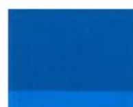
225 ■ ★★★★★ Cyan Blue P.B. 15:1 / P.W.6