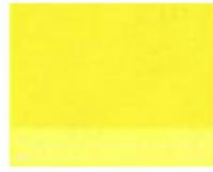
125 ■ ★★★★★ Yellow lemon P.Y. 3 -10G