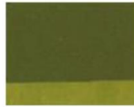
256 ■ ★★★★★ Olive Green P.Y. 42 / P.Y. 150 / P.G. 7