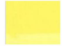
135 ■ ★★★★★ Naples Yellow Light P.Y. 184 / P.Y. 216 / P.W. 6