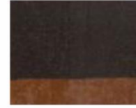
211 ■ ★★★★★ Burnt Umber P.Br. 7