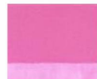
160 ■ ★★★★★ Permanent Rose Light P.R. 122 / P.W.6