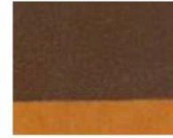
202 ■ ★★★★★ Dark Ochre P.Br. 6 / P.Y. 150