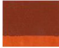
183 ■ ★★★★★ Pozzuoli Earth P.R. 101 L / P.Y. 150