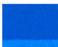
223 ■ ★★★★★ Cobalt Blue light P.B.28 / P.B.29 / P.W.6