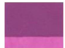
243 ■ ★★★★★ Cobalt Violet Light P.V. 15 / P.R. 122 / P.W.6