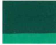
253 ■ ★★★★★ Permanent Green P.G.7 / P.Y.184 / P.W.6