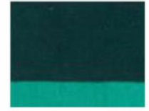
263 □ ★★★★★ Oxide Green Deep (phthalo) P.G. 7