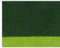
257 □ ★★★★★ Sap Green P.G. 7 / P.Br. 25 / P.Y. 150