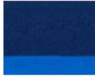
233 ■ ★★★★★ Phthalo Blue P.B. 15:3