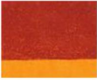
134 □ ★★★★★ Transparent Golden Orange