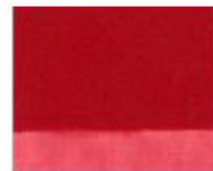
187 ■ ★★★★★ Cadmium Red (imitation) P.R. 254 / P.R. 264 Op.