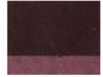
170 ■ ★★★★★ Oxide Violet P.R. 101 V