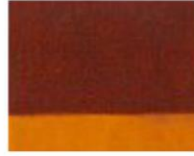
205 □ ★★★★★ Transparent Golden Brown P.Br. 25 / P.Y. 150