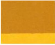
131 ■ ★★★★★ Light Ocher P.Y. 42