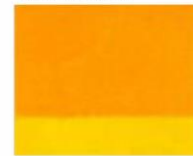
124 □ ★★★ Indian Yellow P.Y.110 / P.Y. 83