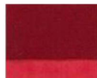
169 □ ★★★★★ Permanent Madder Brown P.R. 206