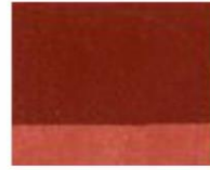
184 ■ ★★★★★ English Red Light P.R. 101 L