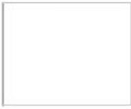
102 □ ★★★★★ Transparent White P.W.18