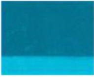
230 ■ ★★★★★ Cobalt Turquoise Deep P.G. 50 G / P.B. 36