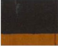
215 ■ ★★★★★ Asphalt Lac P.Br.25 / P.Y.150 / P.V.19 / P.Bk.7